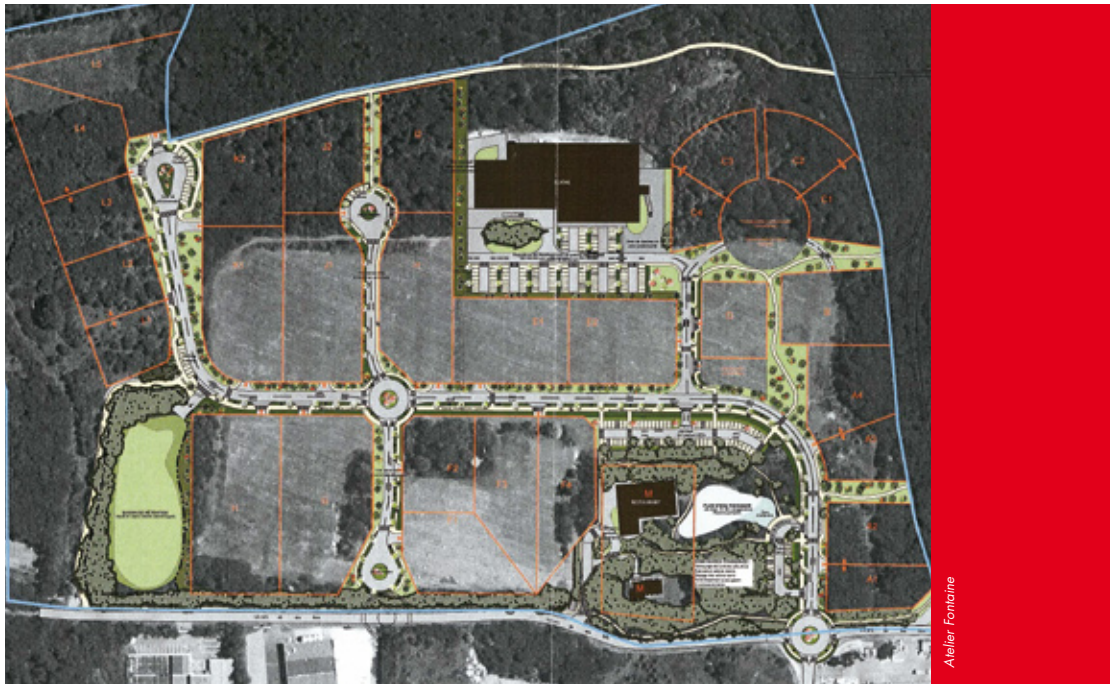
Plan de masse Technosite Altéra